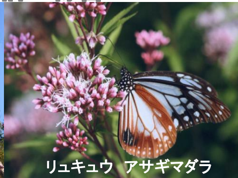
リュキュウ アサギマダラ