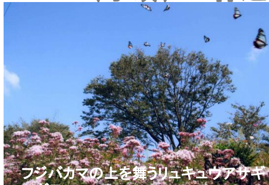
フジバカマの上を舞うリュキュウアサギ