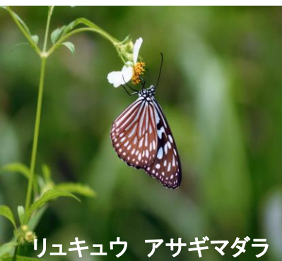
リュキュウ アサギマダラ